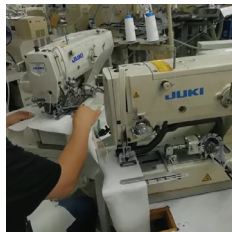
一人同时操作两台机器