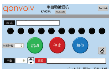
简易触屏操作界面

用于针织圆领辘领及橡筋裤辘裤头工序。机械结构结合参数化设置代替人工容布，降低对员工缝纫技能依赖。