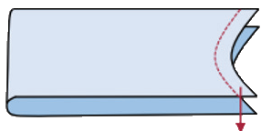
对折罗纹领单针平车线驳领