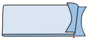
真开骨止口示意图