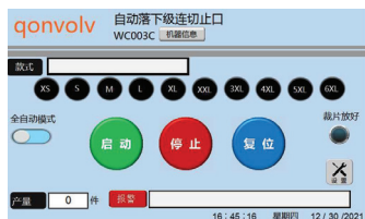
触摸屏操作一键转码