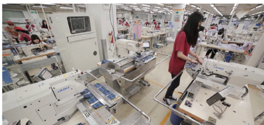
一人同时操作3台机器