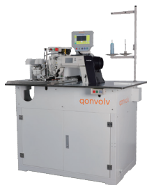
可選配 Brother 縫紉機型號 - WC005C-SC